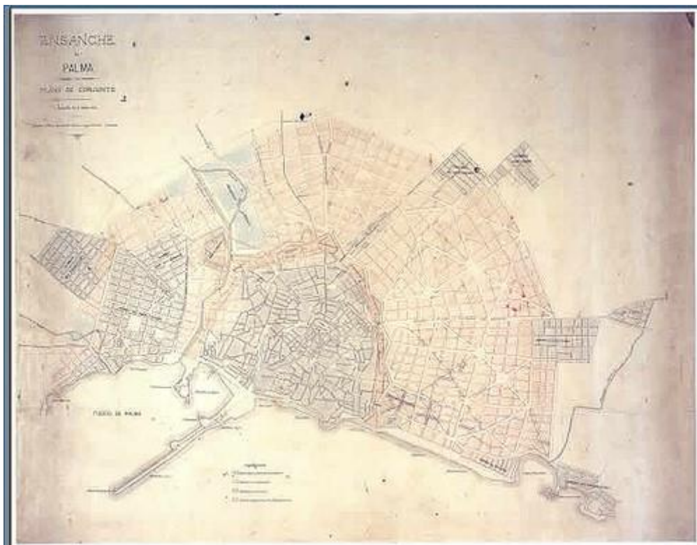
Mapa del Pla Calvet de 1901

A l'eixample la especulació dels anys 60 fou terrible, es varen construir edificis de 7 o 8 plantes al carrers del 10 metres i el cotxe es va menjar el qui hi quedava a les Avingudes i altres indrets, i així tenim la ciutat que tenim, amb una arquitectura espantosa. Com és pot ordenar?¿Com rectificar els errors?