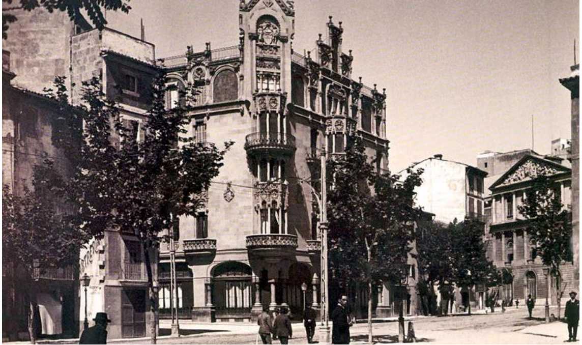
El Gran hotel als seus inicis.

El turisme no es nociu però s'ha de fer amb un pla raonable i consensuat per evitar els efectes nocius, amb respecte a la cultura i el medi ambient. El turisme no es nociu en si mateix, però es necessari establir criteris raonables per evitar els efectes devastadors que pot ocasionar la mala gestió del turisme.