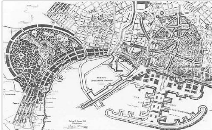
Plan General de Reforma de Palma (Bennazar)

Després es dona una passa sortint del modernisme cap al racionalisme. Aquí hi havia arquitectes que treballaven més amb encàrrecs privats que amb edificis públics. Arquitectes que connecten amb el moviment català del Gupac. En aquests temps dels 20 i dels 30, hi ha millors arquitectures de la que es varen fer a partir dels 40 .