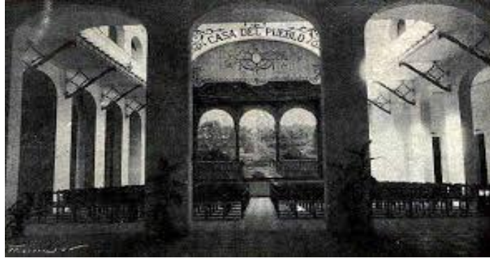
Casa del Poble, finançada per Joan March, inaugurada el 1924 i derruïda el 1975

Encontre realitzat el dilluns 22 de febrer a les 18h. Col·legi d'Arquitectes.