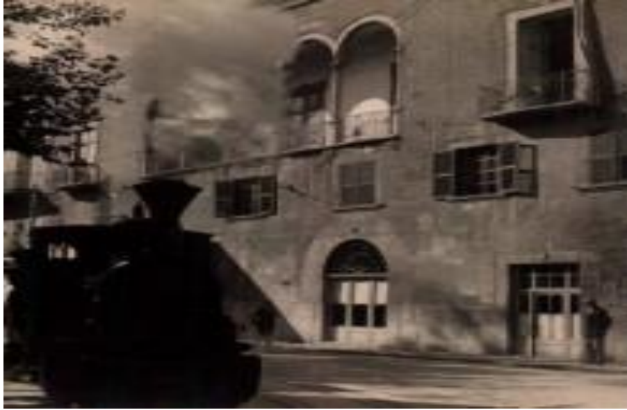
Imatge del ferrocarril passant davant el Solleric